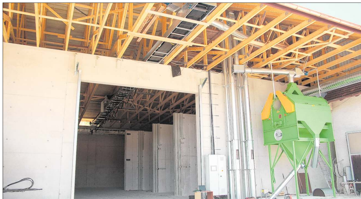
Der Landhandel Kellerer wurde vor zehn Jahren gegründet und vor wenigen Tagen durch den Neubau einer circa 1000 Quadratmeter großen Lagerhalle erweitert.

Landhandel Kellerer: Neue Lagerhalle mit leistungsstarker Anlage in Betrieb