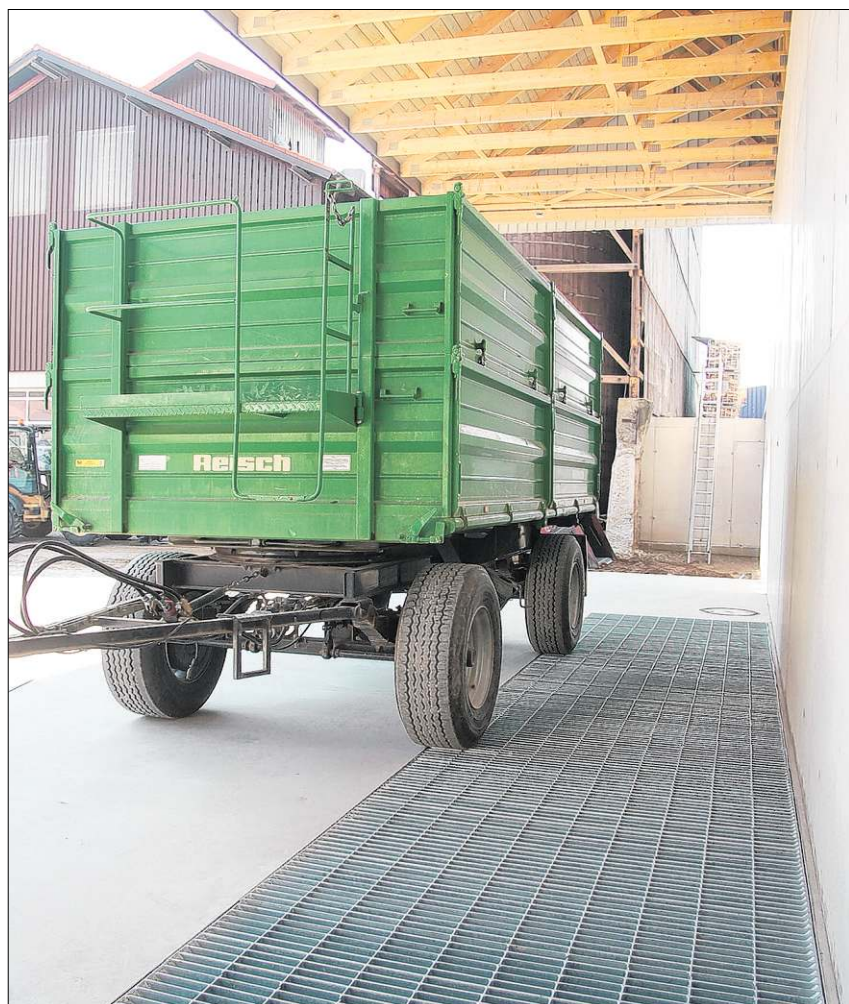
Die Schüttgasse an der Anlieferungsrampe hat ein Fassungsvermögen von etwa 30 Tonnen.